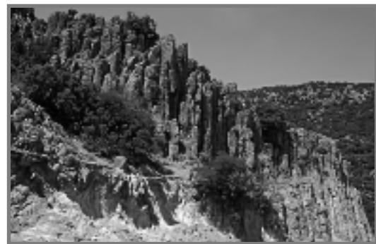
Η Unesco αναγνώρισε την ομορφιά και την ιδιαίτερη γεωλογική κληρονομιά του νησιού μας.

Αυτό ήταν περίπου το πνεύμα της ομιλίας του κ. Ζούρου, το οποίο προσπάθησα