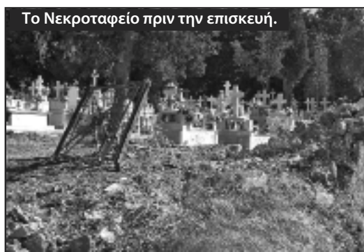
Το Νεκροταφείο πριν την επίσκεψη.

Είμαστε υποχρεωμένοι να εκφράσουμε τις ευχαριστίες μας στους ανώνυμους συγχωριανούς μας που με την οικονομική ενί-