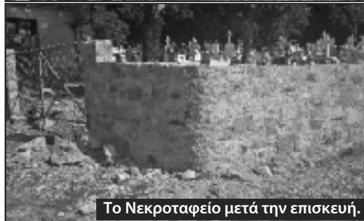
Το Νεκροταφείο μετά την επίσκεψη.

σχυσή τους συνέβαλαν στην πραγματοποίηση αυτού του έργου.