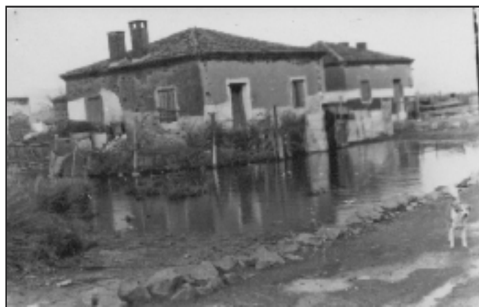
Φωτογραφία από τον προσφυγικό συνοικισμό στην Σκάλα.

Μια που συνεχίζω να αντιγράφω την ίδια Μυτιληναϊκή εφημερίδα, χάριν της τοπικής ιστορίας, παραθέτω ακόμα μία ανταπόκριση: «Δύο ημέρας μετά την γνωστήν υπ'των αγνώστων ληστεϊάν των χρημάτων των προσφύγων Πολιχνίτου, ο Ταμίας της Επιτροπής των Προσφύγων Βρυσάς κ. τάδε (υπάρχει ονοματεπώνυμο αλλά για ευνόητους λόγους δεν το αναφέρουμε) ενεθυμήθη ότι και τούτου αφήρεσαν οι λησταί κάποτε 125 δραχμάς. Και υπό την πρόσφιν αυτήν κατακρατεί από τους δυστυχείς πρόσφυγες άλλου μεν δύο δραχμάς, άλλου δε μίαν και ημίσειαν δια να συμπληρώση το ποσόν των 125 δραχμών, αίτινες κατά τους δισχυρισμούς του αφηρέθησαν υπό των αγνώστων ληστών, στερών ούτω το ψωμί πτωχών οικογενειάρχων και δυστυχών προσφύγων. Αγανακτησμένοι οι πρόσφυγες προσήλθον σήμερα εις τον Αστυνομικόν Σταθμάρχη και κατήγγειλαν το γεγονός, καταθέσαντος ενός εκ τούτων και κίβδηλον μετζήτιον, όπερ ο περί ου ο λόγος Ταμίας των Προσφύγων Βρυσάς έθεσεν εν κυκλοφορία. Τόσον διά την πράξιν της κατακρατήσεως διακατεχομένου ξένου χρήματος, όσον και διά την κυκλοφορίαν κίβδηλου νομίσματος επεδόθησαν αι προσήκουσαι μηνύσεις.