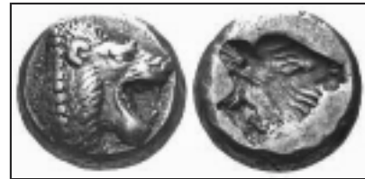
«Έκτη» του Αρχαιολογικού Μουσείου Μυτιλήνης

Στην πόλη της Μυτιλήνης το 400 π.Χ. διεξάγεται μια σημαντική δίκη. Δικαστές είναι έξι άρχοντες από τη Μυτιλήνη και τρεις από τη Φώκεια. Η υπόθεση είναι ότι βρέθηκαν δύο κίβδηλα νομίσματα ένα στην αγορά της Μυτιλήνης και ένα στην αγορά της Φώκαιας. Τα νομίσματα ανακάλυψαν οι αργυραμοιβοί Μητρόδωρος και Αμφάρετος από τις παραπάνω πόλεις αντίστοιχα. Και οι δυο αργυραμοιβοί όταν ανακάλυψαν τα κίβδηλα νομίσματα στράφηκαν στους δυο επίσημους δοκιμαστές των πόλεων τους, οι οποίοι τα βρήκαν πράγματι ελαφρύτερα. Οι δοκιμαστές απευθύνθηκαν στη νόμιμη εξουσία της πόλης της Μυτιλήνης και επειδή τα νομίσματα είχαν το σήμα της Μυτιλήνης, σύμφωνα με τη συμφωνία των δύο πόλεων το δικαστήριο θα γίνει στη Μυτιλήνη. Υπόδικοι είναι ο Κέρνας* και οι δυο βοηθοί του. Μάρτυρες κατηγορίας ο Αμφάρετος (που ήρθε από τη Φώκεια), ο Μητρόδωρος και οι δυο δοκιμαστές (Απολλώνιος και Αρίσταρχος). Οι υπόδικοι θα προσπαθήσουν να αποδείξουν την αθωότητά τους.