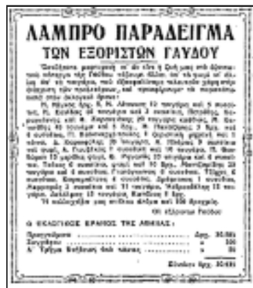
Από το πρωτοσέλιδο της εφημερίδας Ριζοσπάστης της 15/7/1933 για τις προσηφές των εξοριστών της Γαύδου στον εκλογικό αγώνα του ΚΚΕ. Οι Χαράλαμπος Δελόλμας και Γιάννης Ανδρεαδέλλης προσφέρουν 15 και 12 τσιγάρα αντίστοιχα.