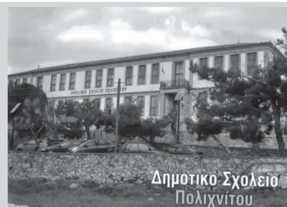
Δημοτικό Σχολείο Πολιχνίτου