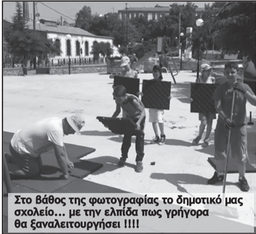
Στο βάθος της φωτογραφίας το δημοτικό μας σχολείο... με την ελπίδα πως γρήγορα θα ξαναλειτουρήσει !!!!

Ένοιωσα δε ντροπή γιατί καθόμουν υπό σκιά με εξαιρετική παρέα και με ένα καφέ στο χέρι. Άλλο να συζητάς τα θέματα και άλλο να γονατίζεις, να σκύβεις, να ιδρώνεις και να τα λύνεις...!!!! Πόσο τυχεροί είμαστε που υπάρχουν συγχωριανοί μας που είναι ΔΑΣΚΑΛΟΙ ΜΕ ΕΡΓΑ. Τους ευγνωμονώ που υπάρχουν...!!!!