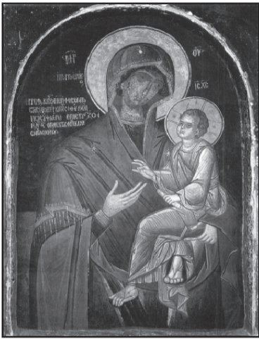
Η Ιερά Εικόνα της Παναγίας Γοργοϋπηκούς, από τον Οκτώβρη 2017, βρίσκεται στον Ιερό Ναό Αγίου Γεωργίου Πολιχνίτου, προς ευλογία των πιστών.

Η γνωστότερη μετά την «Πορταίτσια» θαυματουργή εικόνα του Αγίου Όρους είναι αρχαία τοιχογραφία της Παναγίας που βρίσκεται εξωτερικά στον ανατολικό τοίχο της τράπεζας και προς τα δεξιά της εισόδου της. Το 1664 μ.Χ. ο τραπεζάρης Νείλος, που περνούσε τακτικά μπροστά από την εικόνα κρατώντας στο χέρι αναμμένα δαδιά για την υπηρεσία του στην τράπεζα, άκουσε μια φωνή να του λέει τα εξής: «Να μην ξαναπεράσεις από εδώ με δαδιά καπνίζοντας την εικόνα μου». Ο Νείλος δεν έδωσε ιδιαίτερη σημασία στη φωνή, η οποία όμως σύντομα ξανακούστηκε επιτιμώντας τον μοναχό και αφήνοντάς τον τυφλό. Οι αδελφοί άρχισαν να περνούσαν με πολύ ευλάβεια μπροστά από την εικόνα, της κρέμασαν ακοίμητο καντήλι και διέ-