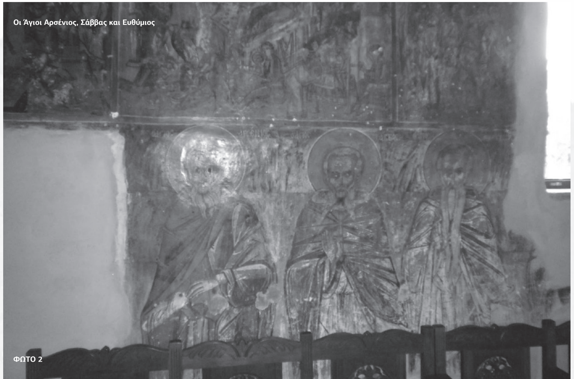
Οι Άγιοι Αρσένιος, Σάββας και Ευθύμιος