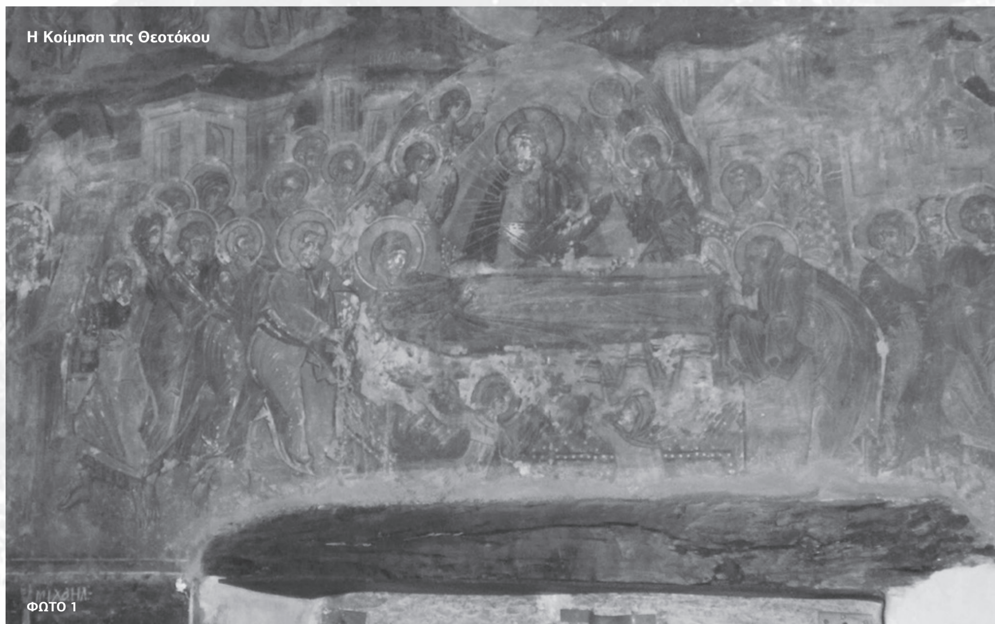
Η Κοίμηση της Θεοτόκου

Οι ωραίες τοιχογραφίες με χτυπημένα τα πρόσωπα και τα μάτια από το θρησκευτικό φανατισμό των Τούρκων στολίζουν όλους τους τοίχους και το Ιερό. Είναι βυ-