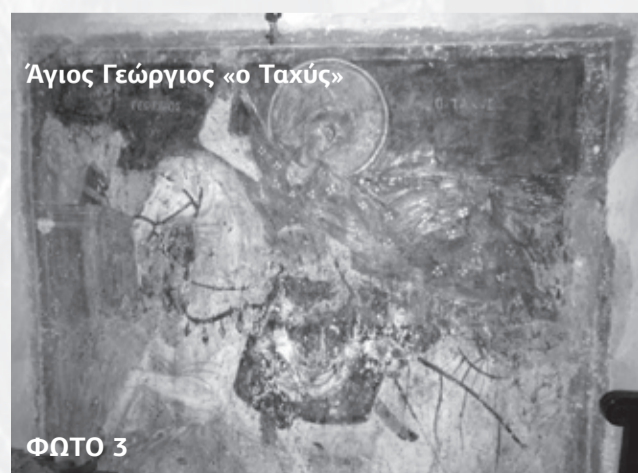
Άγιος Γεώργιος «ο Ταχύς»